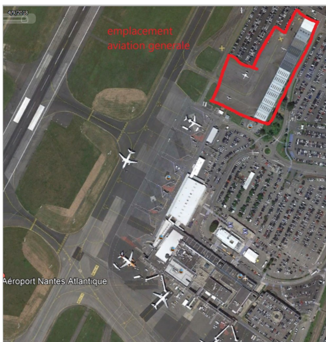
A Nantes Atlantique, une emprise importante de l'aéroclub en plein cœur de l'aéroport... Il y aurait de nombreux avantages au déplacement (au moins partiel) de l'aéroclub à un endroit moins central.